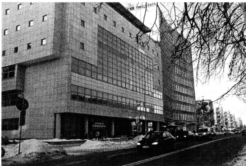
Fot. 1. Nowy gmach Biblioteki Uniwersyteckiej

Kubatura budynku wynosi 34 802 m 3 , w tym powierzchnia użytkowa 8 324 m 2 . Przewidziano, że magazyny pomieszczą 860 tys. woluminów, a czytelnicy będą mieli do dyspozycji 327 miejsc. W magazynie otwartym (z wolnym dostępem do półek) w przyszłości znajdzie się ponad 100 tys. woluminów, w układzie rzeczowym UKD, przewidziano też 110 miejsc dla czytelników. Stworzone zostaną dziedzinowe stanowiska informacyjne dla użytkowników korzystających z wolnego dostępu.