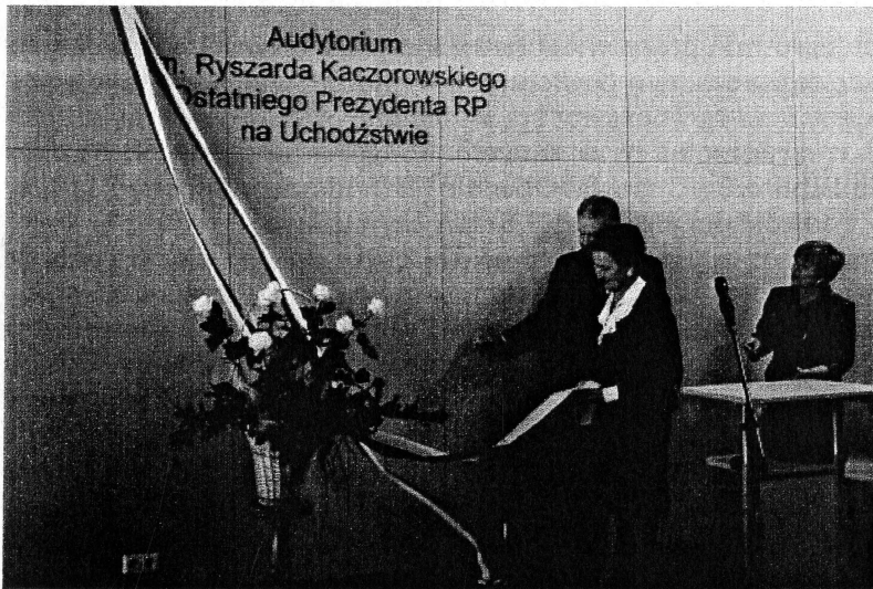
Fot. 3. Uroczyste nadanie im. R. Kaczorowskiego Ostatniego Prezydenta RP na Uchodźstwie audytorium Biblioteki Uniwersyteckiej

Rozpoczęło tu działalność Podlaskie Forum Bibliotekarzy – stanowiące płaszczyznę współpracy i wymiany poglądów całego środowiska bibliotekarskiego. Zaproszono do udziału w spotkaniach biblioteki akademickie miasta Białegostoku oraz bibliotekarzy ze wszystkich typów