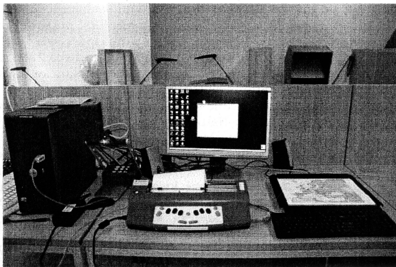
Fot. 4. Stanowisko dla osób niedowidzących